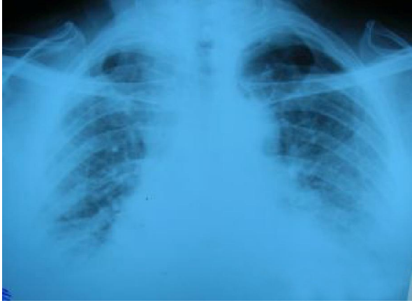
Resim 1. Preoperatif postero-anterior akciğer grafisi

Postoperatif dönemde komplikasyon gelişmeyen hasta 4. gün şifa ile eksterne edildi