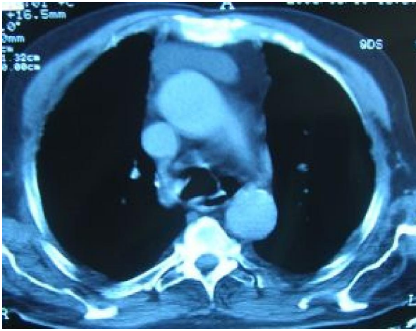
Resim 2. Preoperatif bilgisayarlı toraks tomografisi mediasten görünümü