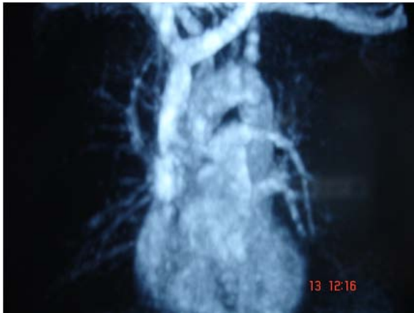
Resim 3. Sağa göre sol pulmoner arter dallarında belirgin kalibrasyon azalmasını gösteren pulmoner MR anjiyografisi