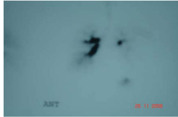
Resim 5. Sağa göre belirgin azalmış sol akciğer ventilasyonunu gösteren ventilasyon sintigrafisi

Ventilasyon sintigrafisinde, sol akciğer alt lob bazalinde daha fazla olmak üzere inhalasyon volümü azalması gözlemlendi (Resim 5).