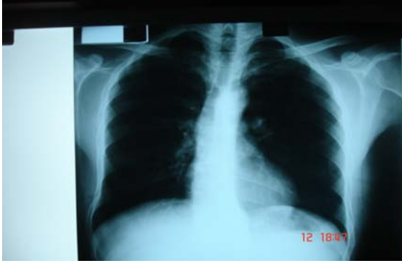
Resim 1. Sol hemitoraksda havalanma artışı gösteren PA akciğer grafisi

Akciğer perfüzyon sintigrafisinde, sol akciğer perfüzyon alanı daralmış ve perfüzyon ileri derecede azalmış bulunurken, bazal segmentlerin tamamına yakın kesiminde perfüzyon defekti saptandı (Resim 4).