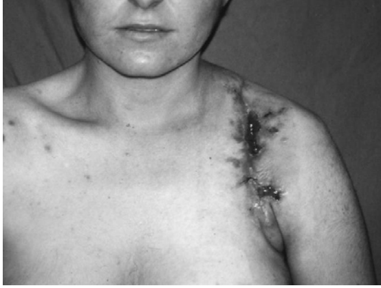
Resim 1. Pre-op görünüm