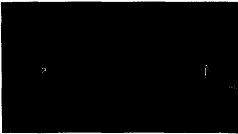
Resim 1. Ameliyat öncesi kompüterize toraks tomografisi

Intraparankimal kistler çıkartılırken 1-1,5 cm'lik bir kız vezikülün pulmoner arterin segmental dalının içinde olduğu görüldü. Ayrıca iki ayrı küçük bronş içinden de kız vezikül çıkartıldı. İki kez TA: 0-40 mmHg'ya düştü. Anafaktik şok düşünülüp vasokonstrüktör ajanlar ve prednizolon: 250, 750, 1250 mg dozlarında üç kez i.v. uygulandı. İntraoperatif yapılan muayenede perikardiyal boşlukta ve kalpde kist ile uyumlu bulgu yoktu. Operasyon sonunda flexibl bronkoskopi ile sol ana bronş içinde kist membranları gözlemlendi ve aspire edilerek temizlendi. Hasta postoperatif üç saat volüm respiratöre bağlı kaldıktan sonra ekstübe edilebildi. Postoperatif dönemde başka komplikasyon gelişmedi, toraks tüpleri postoperatif 8. ve 19. gün çekildi. Bu süre içinde hastaya albendazol tedavisine devam edildi. Yirmidokuzuncu gün genel durumu iyi olan kontrol grafilerinde operasyon tarafında patoloji saptanmayan karşı tarafta multipl kistleri sebat eden hastaya, üç ay albendazol 800mg/gün (10 mg/kg/gün, üç dozda) önerilip taburcu edildi. Poliklinik takiplerinde hastanın opere edilmeyen taraftaki kistlerinin giderek küçüldüğü, bazılarınınınsa kaybolduğu gözlemlendi. Bunun üzerine hasta takibe alınarak operasyondan vazgeçildi. Postoperatif üçüncü ve altıncı aylardaki kompüterize toraks tomografilerinde sağ