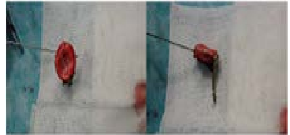
Resim 2a, 2b. Radius başının dışarıda plak- vida yardımı ile rekonstrüksiyonu.