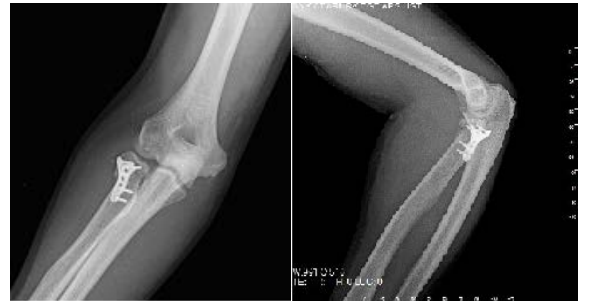
Resim 4a, 4b. Hastanın postoperatif ön-arka ve yan direkt grafileri.