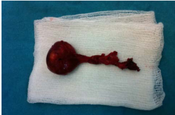
Şekil 3. Eksize edilen ektopik tiroid dokusu adenomu