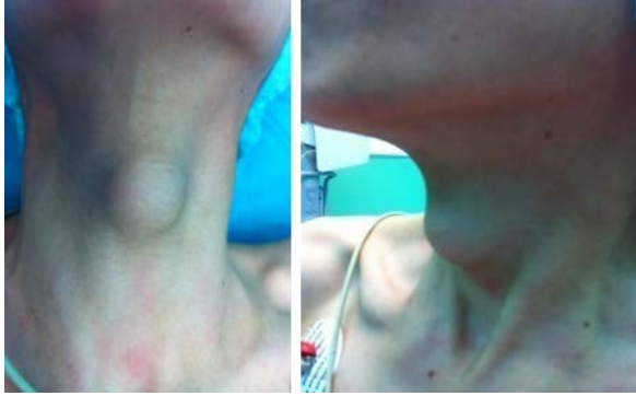
Şekil 1a, 1b. Hastanın ilk başvuru anındaki resimleri

(MR) incelemesinde 2,5×2×2 cm büyüklüğündeki kitlenin tiroid dokusundan ayrı bir kitle olduğu tespit edildi (Şekil 2). Hastanın ameliyat öncesi dönemde yapılan ince iğne aspirasyon biyopsisi (İİAB) ve tiroid fonksiyon testleri tetkikleri normal saptandı. Hastaya kitlenin total eksizyonu cerrahisi yapıldı. Spesmenin histopatolojik incelemesinde tiroid adenomu tanısı konuldu (Şekil 3). Hastanın operasyon sonrası kontrollerinde tiroid fonksiyon testleri normal sınırlar içerisindeydi.