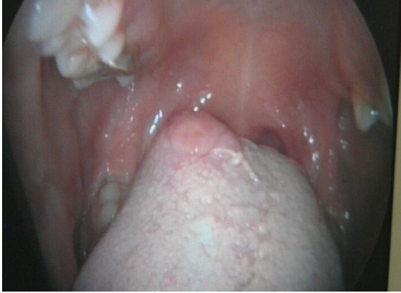
Resim 1. Dildeki lezyonun görüntüsü

hareketleri normal olarak hasta taburcu edildi. 1. hafta, 1. ay ve 3. ay kontrollerinde nüks izlenmedi.